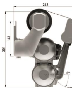
монтаж с презастъпване на рамене