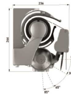
таванен монтаж с хуфта рамо 3,50м