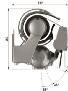
челен монтаж с хуфта рамо 3,50м